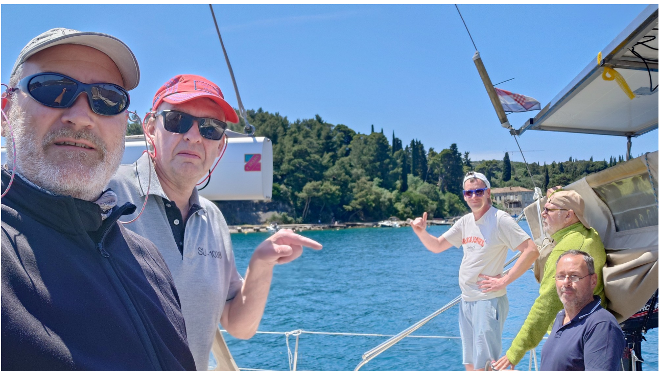
Die vereinigten Crews auf einem Boot – Dubrovnik empfängt uns ...