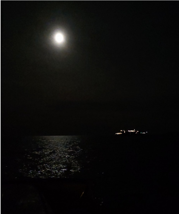
Der Mond begleitet uns durch die Nacht, ebenso ein Kreuzfahrer auf demselben Kurs