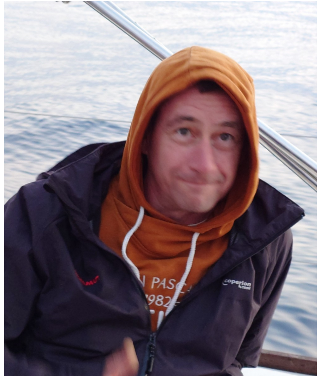
Der B-Schein Aspirant am frühen Morgen