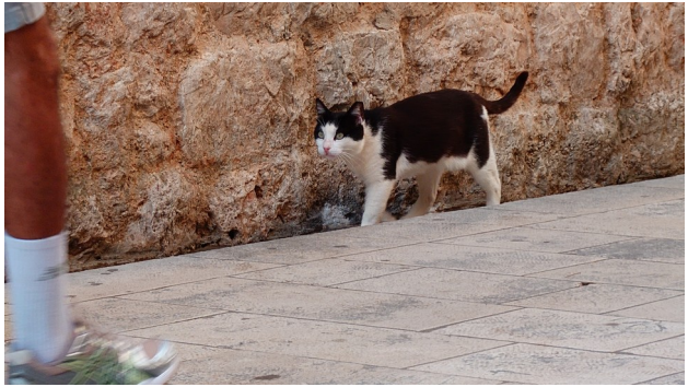
Kroatische Katzen in Dubrovnik ...