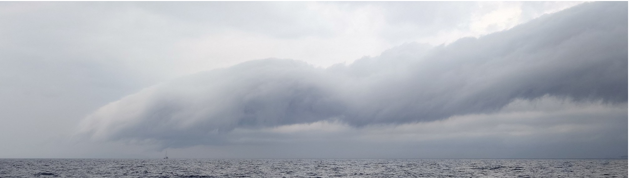
Ein Segler vor dem Gewitter ... als würde die Wolke das Schiff abtasten wollen ...