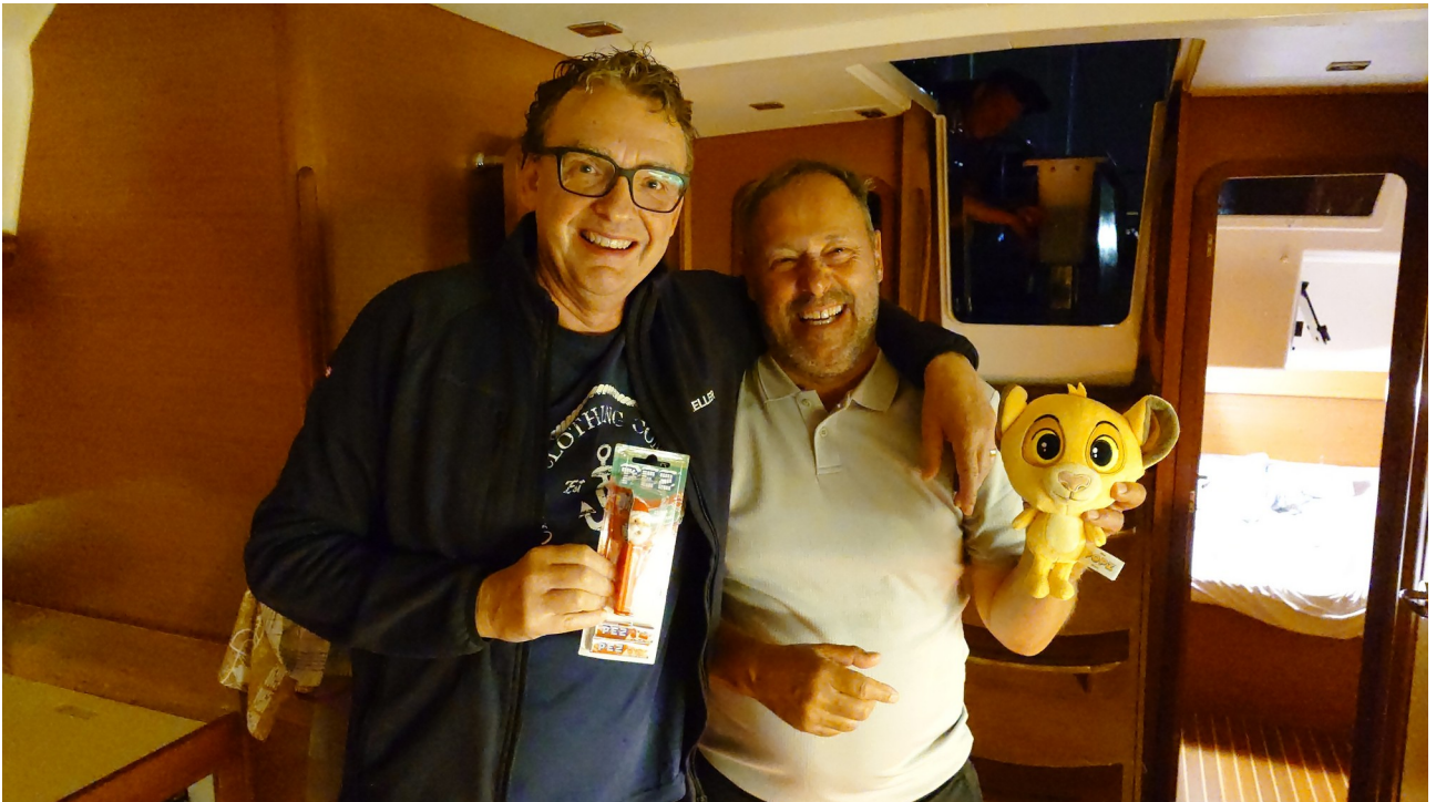
Eine Minute nach Mitternacht - wir feierten den 66igsten Geburtstag von WD7 – lang möge er leben !